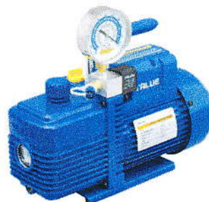
Řada V-i240, V-i240SV, V-i220SV