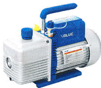
Řada VE215N, VE225N, VE2100N